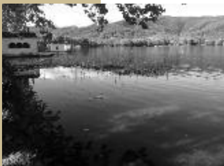
Pesquera Gayolà on es va estassar la vegetació de l'Estany

Les entitats ambientals juguen múltiples rols, que van des de l'organització del voluntariat ambiental per incidir directament a l'entorn fins a la mobilització ciutadana davant dels projectes agressius amb el medi. Tanmateix, no podem oblidar la importància de pressionar les administracions perquè despleguin els instruments necessaris per a preservar els espais naturals. És per això que no ens cansarem d'insistir encara que ens poguem fer pesats.