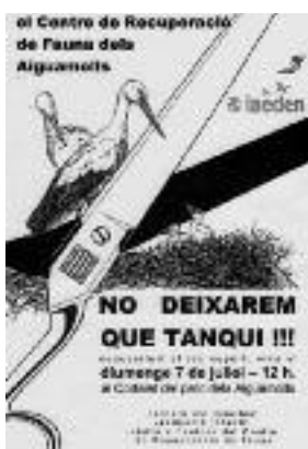
Campanya contra el tancament del Centre de Fauna dels Aiguamolls de l'Empordà

els afectava a tots tres, i el Departament d'Agricultura, Ramaderia, Pesca, Alimentació i Medi Natural (del qual depenen) va decidir tancar-lo. Aquesta decisió, que significava que la província de Girona seria l'única sense cap centre de recuperació de fauna salvatge, va tenir una reacció ràpida, amb una gran mobilització en contra per part de l'IAEDEN, els empordanesos i simpatitzants del centre. Gràcies a aquesta pressió, i després de nombroses reunions, s'ha aconseguit mantenir el centre en funcionament tot l'estiu, amb l'ajut econòmic de la Diputació de Girona i de l'entitat IAEDEN.