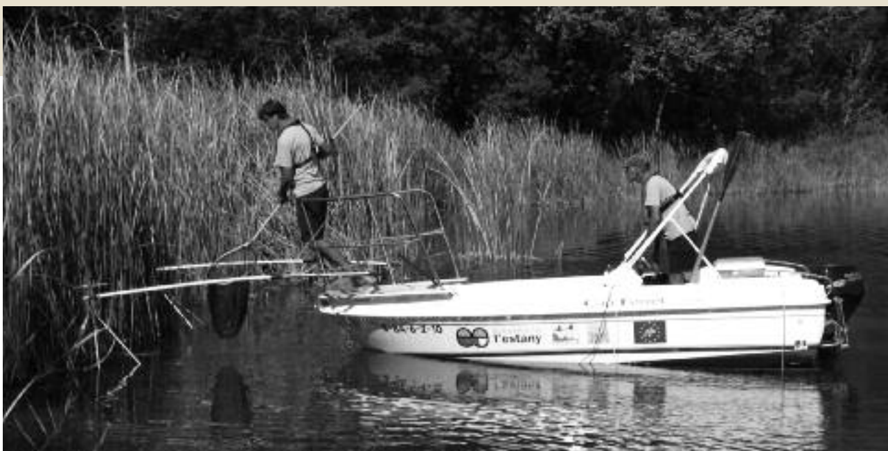
Pesca elèctrica

El Projecte Estany és un projecte dedicat a la recuperació de la biodiversitat original a l'estany de Banyoles, especialment les espècies protegides a nivell europeu com són el barb de muntanya, la tortuga d'estany i la nàiade allargada o musclo de riu. Per a fer-ho, a part de la cria en captivitat d'aquestes espècies i el repoblament, és necessari efectuar un control de les espècies exòtiques invasores presents a l'espai, principalment peixos. El projecte l'executa el Consorci de l'Estany i està finançat pel programa LIFE+ de la Unió Europea.