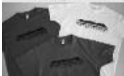
Portada del còmic i samarretes de la campanya «Salvem Sotamonestir»

Agost 2013. Durant els mesos d'estiu de l'any passat, des de la plataforma Salvem Sotamonestir es van dur a terme una sèrie d'accions per difondre la necessitat de preservar aquest espai únic de Banyoles i impulsar-ne un ordenament respectuós que n'aprofiti totes les qualitats com a alternativa al model urbanístic que pretén imposar l'Ajuntament de Banyoles. A part d'editar samarretes es va començar la distribució del còmic «Salvem Sotamonestir» il·lustrat per Quim Bou i editat gràcies a la col·laboració de Limnos. L'acompanya un plànol i diverses fotos amb els elements de patrimoni natural i arquitectònic d'aquesta zona. Es pot descarregar en format digital des del bloc de la plataforma: http://www.salvemsotamonestir.blogspot.com