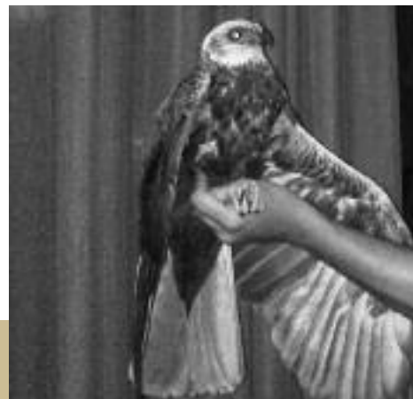
Arpella vulgar mascle

Observadors del noticiari de fauna: AAX: Albert Alonso; AEX: Albert Escriu; AJX: Arnau Juscafresa; BGE: Bienvenido Gómez; CFQ: Carles Feo; CPB: Cristina Pérez; DFP: David Funosas; DLX: Dani Latorre; FTX: Fran Tralobal; GFP: Gerard Funosas; IBX: Irene Barnosell; JBV: Jordi Burch; JSX: Joan Carlos Santiago; MCX: Marc Canal; MFX: Marc Fusellas; MLX: Mike Lockwood; MPX: Marc Puig; RCA: Ramon Casadevall; PFL: Ponç Feliu; XHX: Xavier Higuero; VCX: Víctor Canyadas.