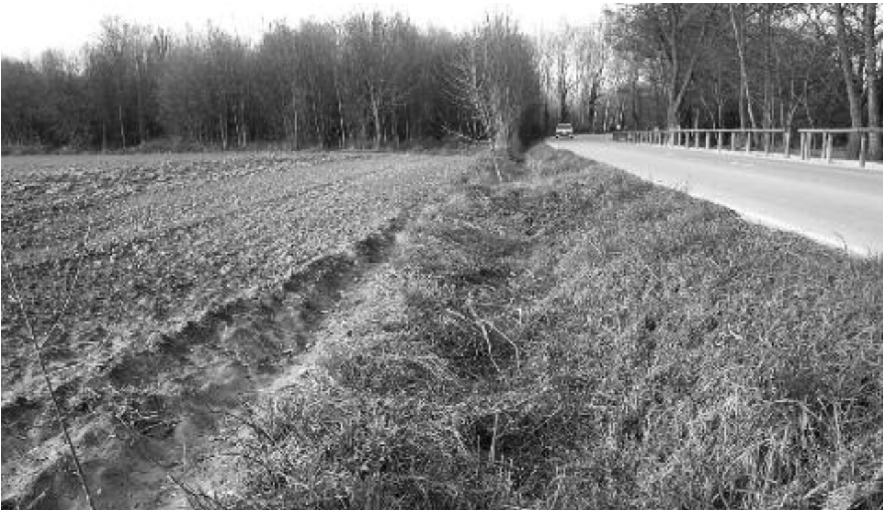
Carretera de Circumval·lació de l'Estany actualment

El projecte, llargament reclamat pels usuaris i les usuàries habituals de l'estany, suposarà l'acabament total del recorregut del carril bici al seu voltant i de la possibilitat de gaudir de l'estany a peu de forma segura. Les obres s'allargaran durant uns tres mesos i suposaran una millora per a vianants i ciclistes.