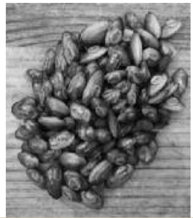
Nàiades juvenils alliberades a l'Estany

Es bons resultats d'aquest projecte LIFE, i la bona línia iniciada en la gestió de l'espai natural tindran continuïtat en el futur. S'ha concedit un altre ajut del programa LIFE+ pel període 2014-2017. El projecte Potamo Fauna treballarà per a la recuperació de la fauna fluvial (cranc de riu autòcton, amfibis, peixos, tortugues, nàiades i el cargol aquàtics) en diversos espais de la xarxa Natura 2000 de les conques dels rius Ter, Fluvià i Muga i en el qual participaran altres entitats, a part del Consorci de l'Estany que n'és el beneficiari coordinador. Esperem que aquestes actuacions i moltes altres que s'aniran desenvolupant serveixin per a què entre tots puguem posar un granet de sorra a favor de la conservació de les singulars espècies i a divulgar un problema de tots com és «l'amenaça de les espècies exòtiques invasores».