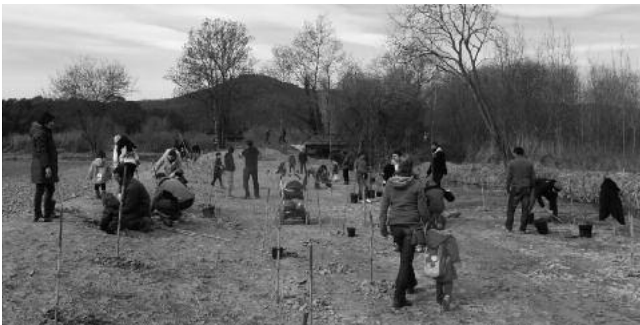
Planta d'arbres a la ribera de Can Morgat el febrer de 2013 dins el projecte Estany

grama LIFE + de la Comissió Europea. Aquest projecte té com a principal objectiu dissenyar i executar una intervenció global per a combatre, alentar i revertir el declivi d'espècies i hàbitats que estan provocant les espècies invasores a l'espai Xarxa Natura 2000, mitjançant accions de control d'espècies invasores i reforçaments poblacionals d'algunes espècies autòctones. Aquest projecte també ha realitzat actuacions sobre els boscos de ribera de l'entorn de l'estany amb el control de plantes invasores i la restauració dels hàbitats de ribera. És un projecte de fons financers dedicats exclusivament a la conservació de la natura i que són una inversió econòmica molt considerable fomentant llocs de treball directes i indirectes.